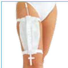
2040 Soft Careline urinebeenzak, 0,5 liter met kruiskraan en beenbandjes

In deze set zitten alle hulpmiddelen om de katheter op een veilige en steriele manier in te brengen.