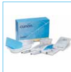
8972 CuriKit blaaskatheterisatieset

Door het inbrengen van een verblijfskatheter urethraal of suprapubisch kan de urine continue worden afgevoerd. Kan ook als afnamekatheter gebruikt worden.