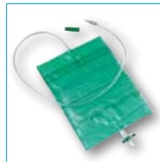
2019 CuriBag urinebedzak, 2 liter met kruiskraan

De beenzak is voor gebruik overdag en kan doorgekoppeld worden naar een nachtzak. De urinezak kan 3-5 dagen aan de verblijfskatheter gekoppeld blijven. Door middel van de beenbandjes wordt de urinezak op het been gefixeerd.