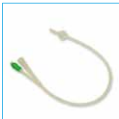
832114 CuriStay siliconen verblijfskatheter CH 14, 5-10 ml

Door het inbrengen van een verblijfskatheter urethraal of suprapubisch kan de urine continue worden afgevoerd. Kan ook als afnamekatheter gebruikt worden.